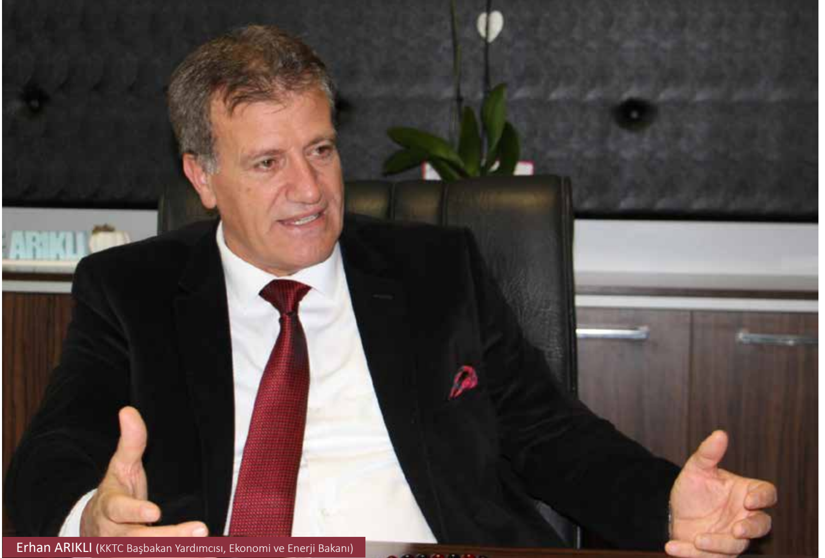
Erhan ARIKLI (KKTC Başbakan Yardımcısı, Ekonomi ve Enerji Bakanı)

Daha az, belki de hiç kazanmayarak sadece sermayeyi koruma yöntemiyle süreci atlatmamız gerektiğini söyleyen Bakan Arıklı, ekonomik süreci KTTO Ekonomi'ye değerlendirdi.