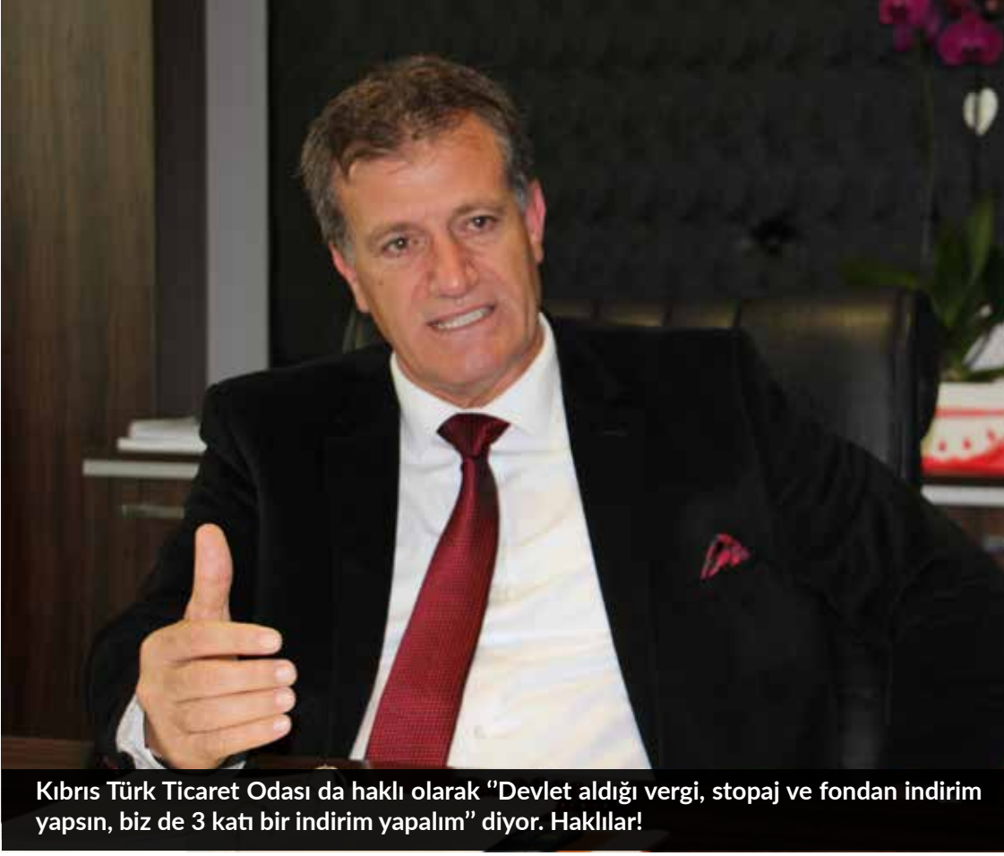
Kıbrıs Türk Ticaret Odası da haklı olarak "Devlet aldığı vergi, stopaj ve fondan indirim yapsın, biz de 3 katı bir indirim yapalım" diyor. Haklılar!

vergi, stopaj ve fondan indirim yapsın, biz de 3 katı bir indirim yapalım" diyor. Haklılar! Ancak devletin çok büyük oranda aldığı stopajdan, vergiden ve fondan fedakârlık yapması mümkün değildir. Çünkü topladığı parayla, maaşlar ödeniyor. O maaşta tekrar piyasaya dönüyor. Devlet gelirleri büyük oranda budanırsa, devlet çalışanına maaş ödeyemez. Maaş ödenmezse, iç çark dönmez ve ekonomi çok büyük krizlere sürüklenir. Bu konu da ölçülü olmalıdır. Elbette devlette birtakım fedakârlıklarda bulunacaktır ama "tamamen sıfırlayın" demek mümkün değildir. Bizim hedefimiz Türkiye ile KKTC arasında Serbest Ticaret Anlaşması'na benzer bir anlaşma imzalamaktır. Bir mal Antalya'dan İstanbul'a nasıl sorunsuz ulaşıyorsa, aynı şekilde Mağusa'ya da gelmelidir. Sadece navlun farkı ödenmeli, onun dışında hiçbir maliyet ile karşılanmamalıdır. Aynı şekilde Kıbrıs'ta üretilen bir ürün de Mersin'e gidebilmelidir. Sadece gıda kodeksine uygun hareket edilmelidir. Geçmişte birtakım sorunlar yaşanmıştı. Türkiye'ye hastalıklı patatesler