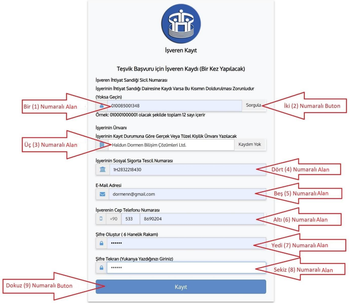
(Şekil 3. İşyeri Kayıt Paneli)