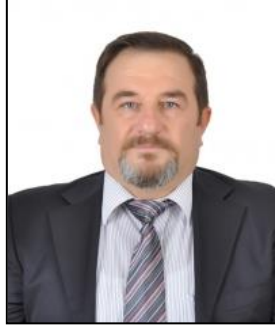
ALİ AAN MECLİS ÜYESİ

AAN DEMİR TİCARET VE SANAYİ LİMİTED ŞİRKETİ