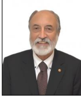
OSMAN ORAL MECLİS ÜYESİ