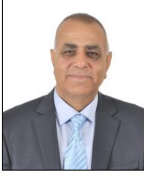
KOÇALI AL MECLİS ÜYESİ

GÜNEYDOĞU NAKLİYAT TİCARET LİMİTED ŞİRKETİ